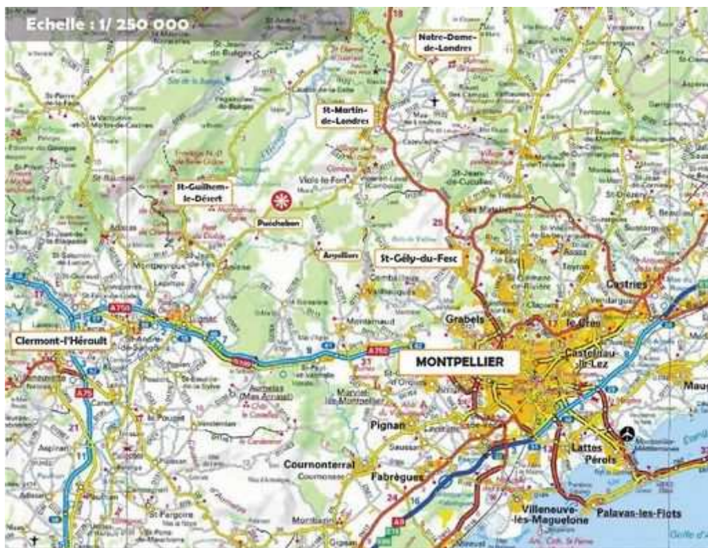
Figure 1: Situation du projet

Pour mémoire, le projet était par ailleurs soumis à autorisation de défrichement. L'autorisation de défrichement a été accordée par arrêté préfectoral du 4 juillet 2015.